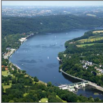
Wie sicher ist die Ruhr?

für ein Projekt, das den Fluss noch sicherer machen soll – als Trinkwasserlieferanten und als Badeoase.