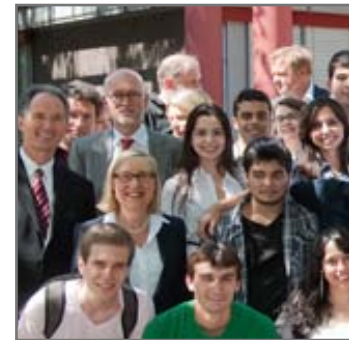
Die UAMR-Rektoren begrüßten die Stipendiaten.

► http://www.uni-due.de/de/presse/meldung.php?id=7649