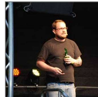
Science Slammer Remfort in Action.

► http://www.uni-due.de/de/campusaktuell/zur_person.php