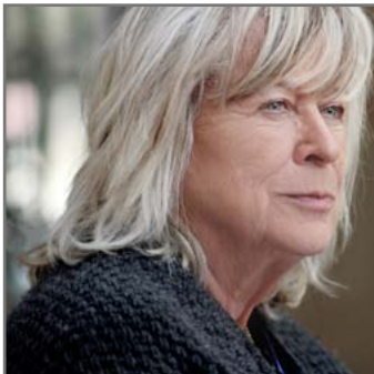
Hielt ihren ersten Vortrag: Mercator-Professorin Margarethe von Trotta.

Wer zum Lernen in die Bibliothek geht, sollte demnächst essenstechnisch vorsorgen: Die Mensen und Cafeterien des Studentenwerks bleiben vom 21. Dezember bis zum 1. Januar auf beiden Campi geschlossen. Auch gibt es Ausnahmen: Das Café Rosso (Campus Essen) und das u-café (Campus Duisburg) sind am 23. Dezember von 7.30 bis 16 Uhr geöff- →