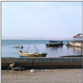
Schwer belastete Wasserquelle: der Lake Qarun 90 km südlich von Kairo