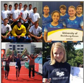
Unsere SportlerInnen (v.): Das Feldhockey-Team, das Badminton-Team, die Triathletinnen und die Weitsprung-Hochschulmeisterin.

► http://www.uni-due.de/hochschulsport/ergebnisse_dhm_2013.shtml