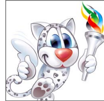
Das Universiade-Maskottchen.

► http://www.adh.de/wettkampf/international/universiade.html