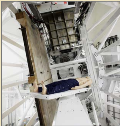
Das WPE von innen.