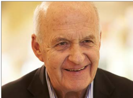
Götz W. Werner.