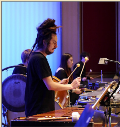
Das UniOrchester wird beim „Dies academicus“ ein Open-Air-Konzert geben.