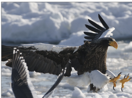
Beeindruckender Seeadler.

► http://www-stud.uni-essen.de/~sh1053/chorsemasterprogramm.shtml