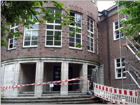
Das Haupttreppenhaus muss och gesperrt bleiben.