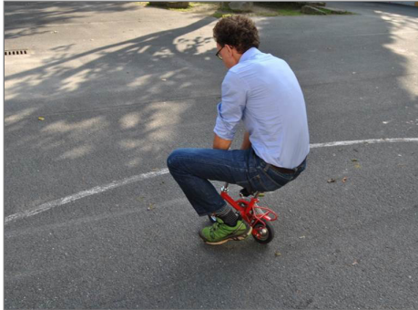
Auf diesem Rad zu fahren, ist schon etwas anspruchsvoll.