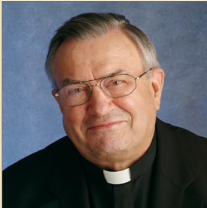
Karl Cardinal Lehmann.