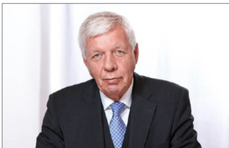
Dr. Werner Müller.

► https://www.uni-due.de/de/presse/meldung.php?id=9614