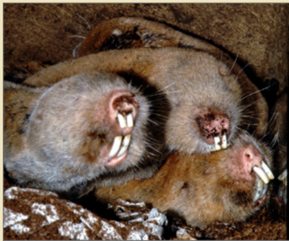
Wie synchronisieren unterirdisch lebende Tiere ihr Verhalten? Dieser Frage geht eines der ausgewählten Forschungsprojekte anhand von Graumullen nach.