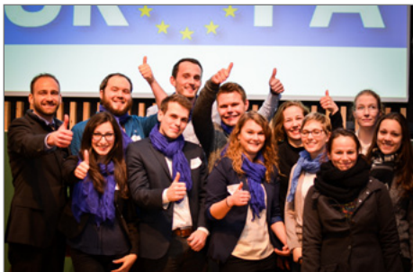
Die Sieger-Teams.

► https://www.uni-due.de/politik/kaeding/lehrstuhlaktivitaeten_2016.php