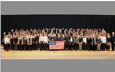
Stimmt sich schon mal auf die USA ein: Der Unichor Essen.

► https://www.uni-due.de/in-east/events/in_retrospect.php