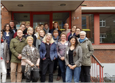
Die Teilnehmenden am Pilotprojekts „KomDiM-Profi LS “.