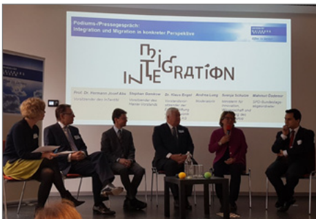
Das Forschungszentrum InZentIM wurde im Beisein von hochrangigen Gästen eröffnet.

► https://www.uni-due.de/de/presse/meldung.php?id=9722