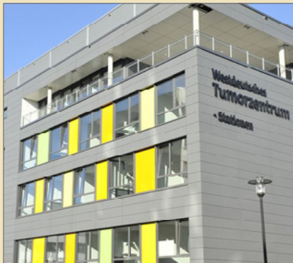
Das Bettenhaus des Westdeutschen Tumorzentrums mit Innerer Klinik (Tumorforschung).