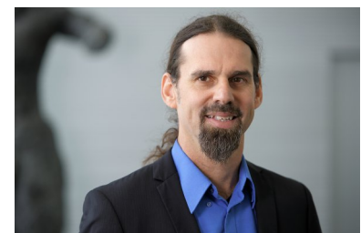
Senior Fellow and co-initiator of the workshop Bild3 ↓