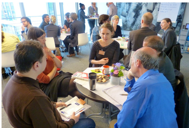
The workshop "Democratic Interventionism and Local Legitimacy" took place 22/23 May. Bild2 ↓

tion Research and the School of Political Science and International Studies of the University of Queensland, the workshop "International Interventionism and Local Legitimacy" on 22/23 May 2013, thus, aimed at elaborating responses to three inter-related areas of inquiry: