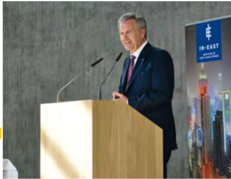
25 Jahre IN-EAST: Festvortrag von Bundespräsident a.D. Christian Wulff 25 years IN-EAST: Ceremonial address by former Federal President Christian Wulff